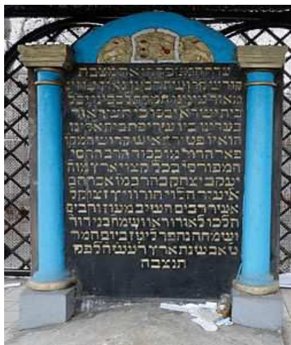
*קברו של החוזה מלובלין בבית עלמין בלובלין.

נתחיל את יומנו השני בסיור בעיירה לומז'ה בה שכנה אחת משיבות תנועת המוסר, נמשיך לאסם בידובנה, ניסעה אל העיירה טקטין וליער להפוחובה. נחתום את היום במחנה ההשמדה טרבלינקה ונערוך טקס לזכרם של הקדושים. ארוחת ערב ולינה בלובלין.